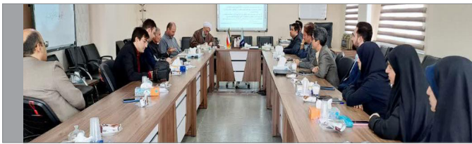
نشست هم‌اندیشی اساتید و نخبگان دانشگاه با محوریت چالش‌های حوزه استادی بر گزار شد

در این جلسه که با حضور جمعی از نخبگان دانشگاه در دفتر نهاد رهبری برگزار شد، اساتید دانشگاه با محوریت چالش‌های نخبگان و مهاجرت ایشان به بحث و تبادل نظر پرداختند. شناخت ریشه‌های مهاجرت نخبگان و اساتید و عوامل دخیل در آن به ویژه برونرکس‌های اداری و بسترهای انگیزه زدا بحث و گفتگو شد.